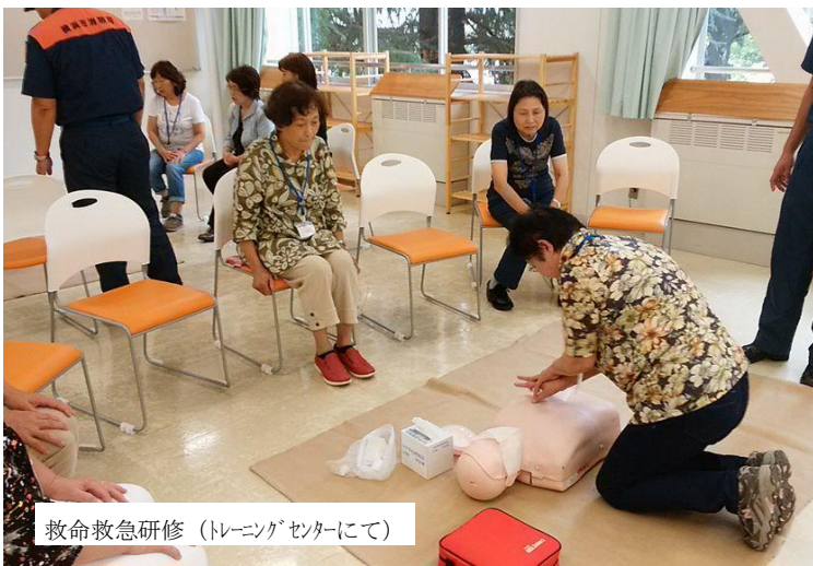
救命救急研修 (トレーニングセンターにて)

皆さん！「AED」聞いたことありますか？みらいでは定期的にAED研修を行っております。 AED…「自動体外式除細動器」。何らかの原因で、心臓がけいれんを起こしてしまい、正常な動きができなくなってしまう。そんな時に助けてくれる医療器具、それがAEDです。取り扱いには資格は不要。専門家による研修を受ければ誰にでも扱える道具です。大切な命を救うために私たちにもできる事はたくさんありますよね。でも、それってどこにおいてあるの？「取ってきて！」って言われても、わからない！！そんなあなた！P. 2 へ GO！