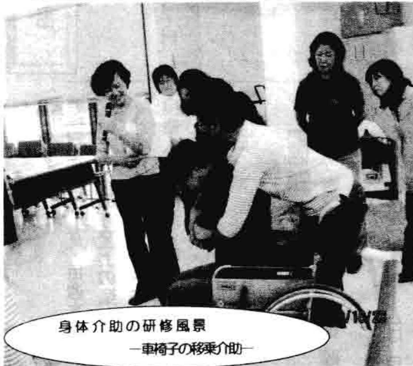
身体介助の研修風景 —車椅子の移乗介助—

介護保険や障害者福祉サービス、移動サービスなど公的なサービスを中心に事業を行っていますが、それ以外の「ミニ・オブ」事業は「お互いさまのたすけあい精神」をモットーにこれからも大切にしていきたいと考えています。