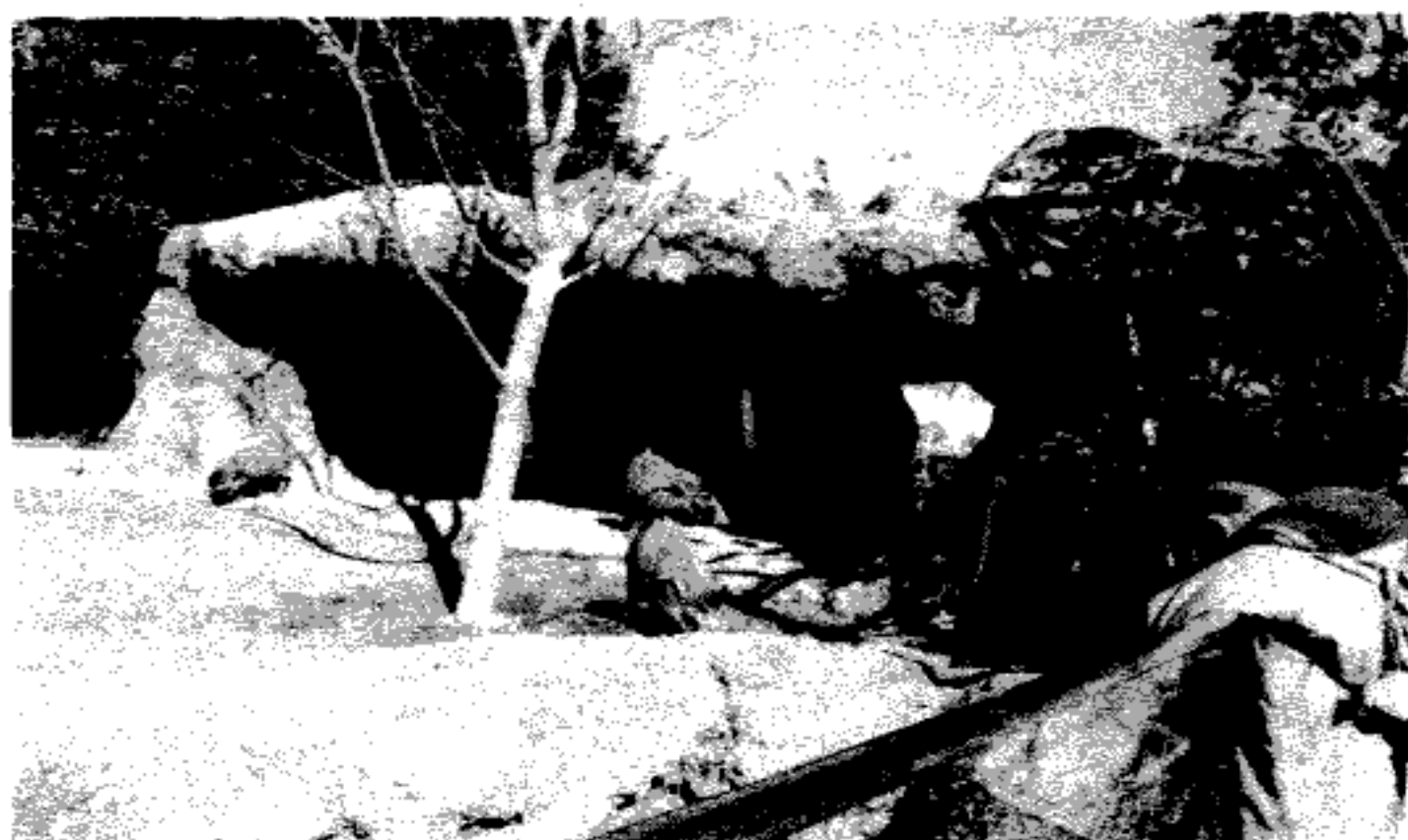
スーラシアにて (2010. 2 ワーカー小森撮影)