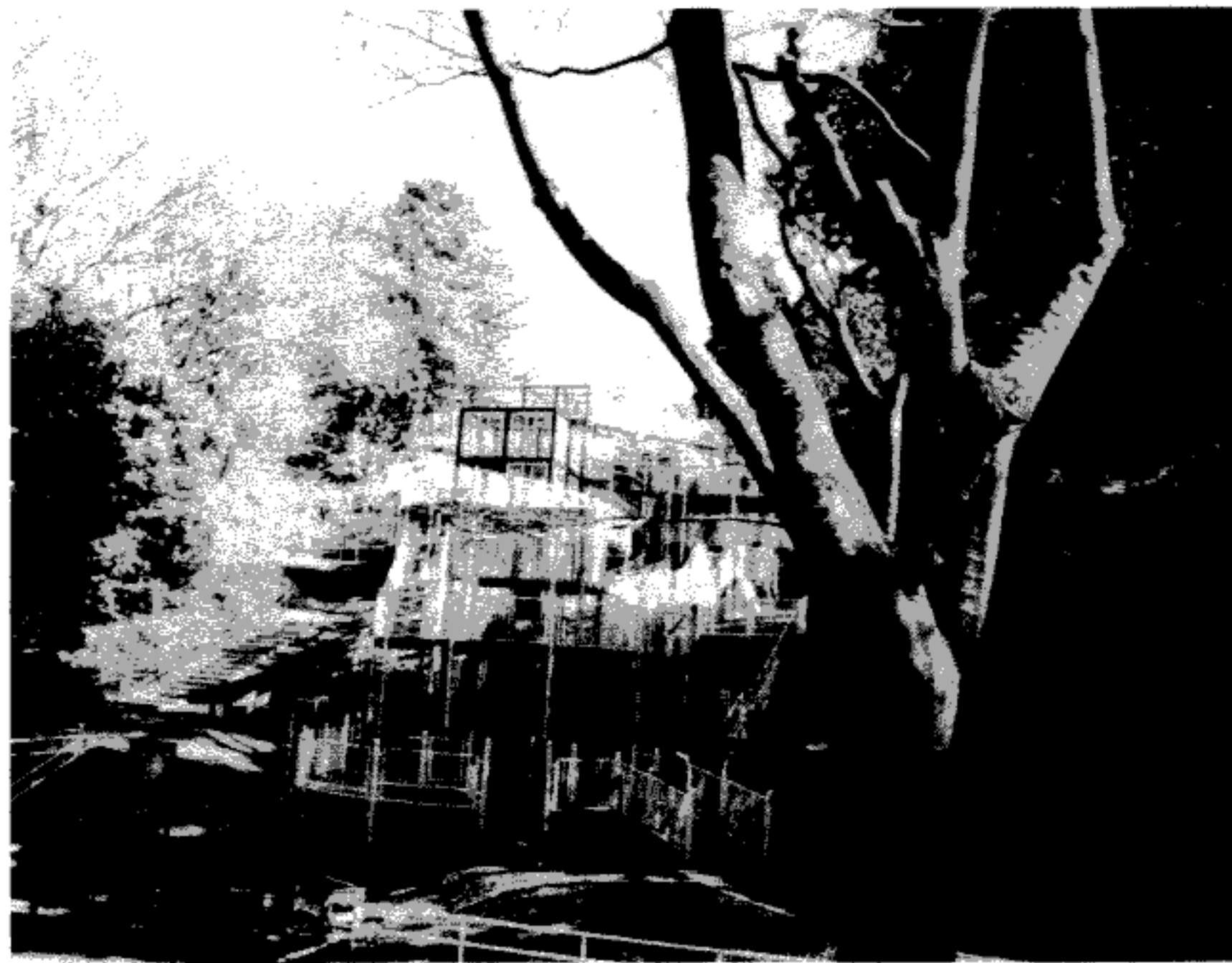
大池公園にて 新しくなったアスレチック (2010. 1 ワーカー小森撮影)

「みらい」も他の事業所同様ヘルパー不足が課題ですが、昨年は3人の方が新しいメンバーとして参加して下さい、大きな力となっています。色々な年代の方が、その経験や知識、体力(?) ややる気を「みらい」で発揮して頂ければと思っています。